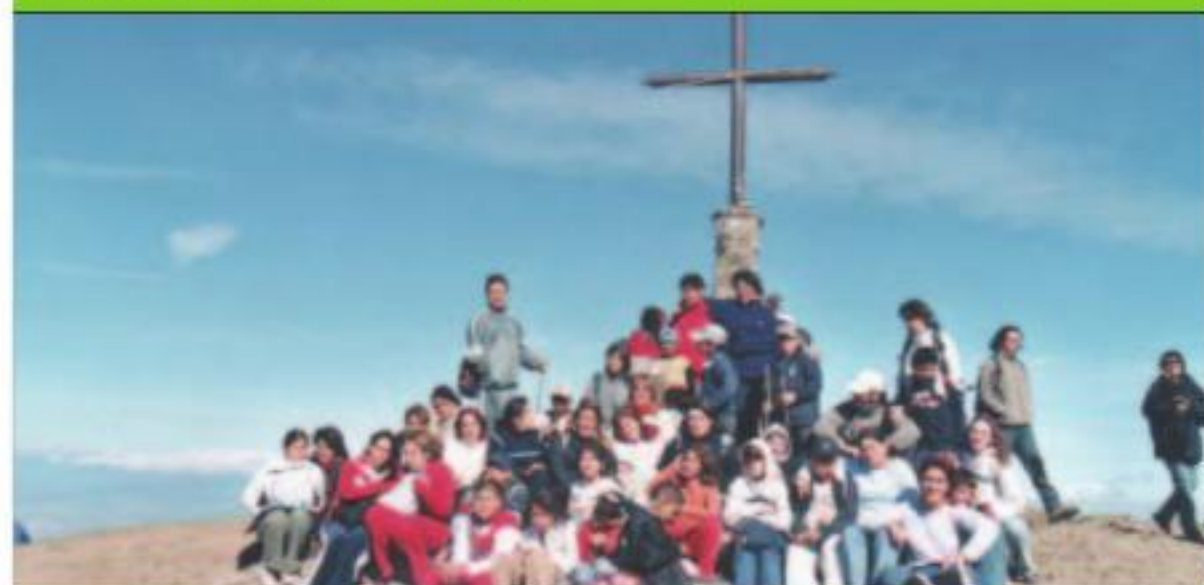
Grup de joves de l'Esplai la Florida i monitors del Mowgli: 20è aniv. Movibaix